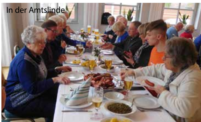
In der Amtslinde