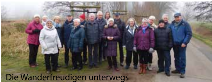
Die Wanderfreudigen unterwegs