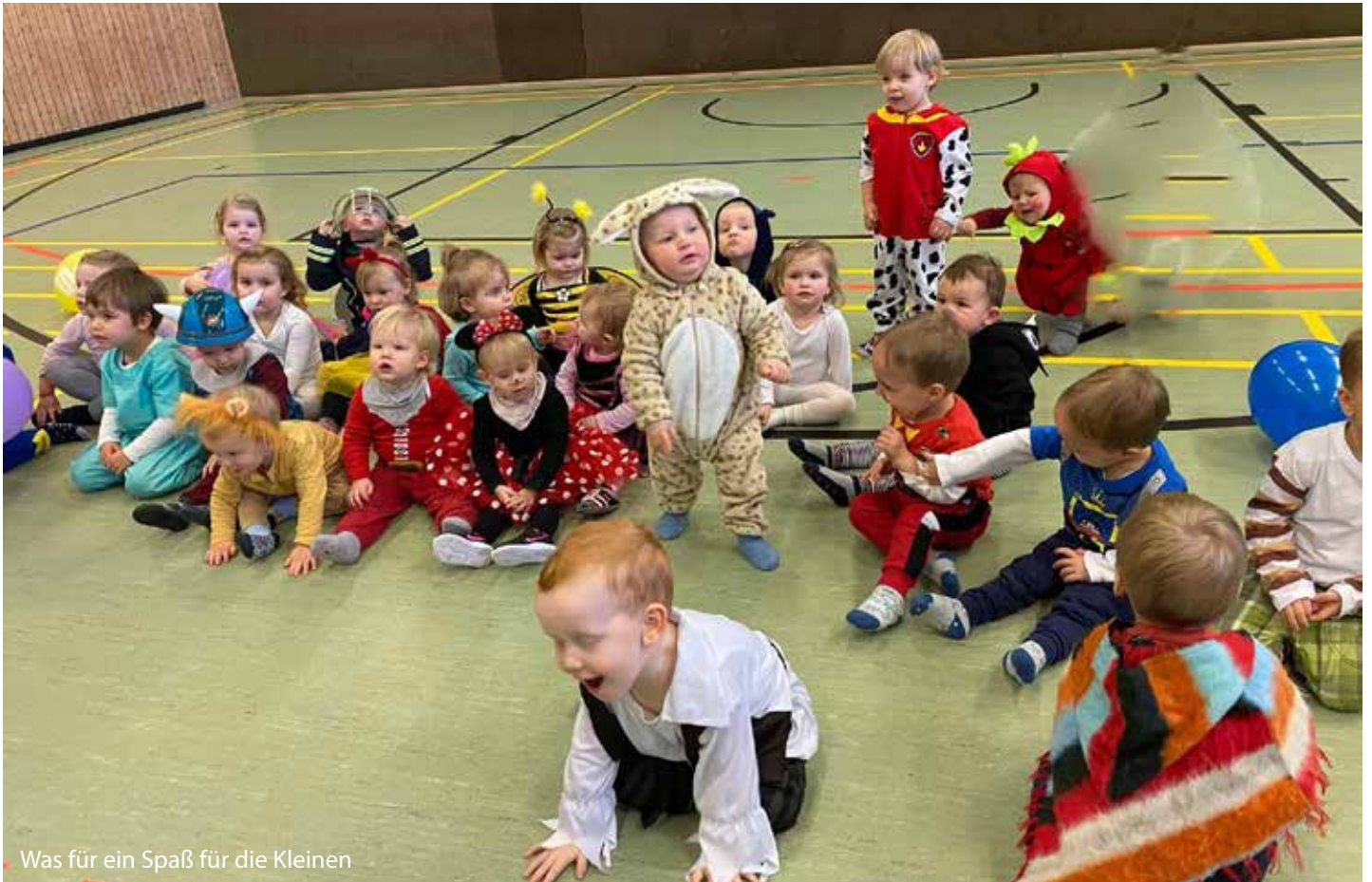
Was für ein Spaß für die Kleinen

Am Faschingsdienstag tobten die Jüngsten in kunterbunten Kostümen durch die Turnhalle. Es gab schöne Bewegungslandschaften, eine Sitzecke und viele Luftballons beim Eltern-Kind-Turnen. Mit Reifen, Hütchen und Bällen wurden die verrücktesten Spiele erfunden. Kleine Feen durchquerten zusammen mit Dinosauriern die Tunnellandschaften. Wicki und die Feuerwehrmänner probierten die Riesenrutsche aus. Die Biene und der Löwe ließen sich gerne von Batman aus dem Schwungtuch befreien. Sogar einige Eltern hatten sich mit Hüten geschmückt, ihre Gesichter bemalt und bunt angezogen. Zur Musik „Das rote Pferd“ schwangen auch Elch, Giraffe und Piraten ihre Hüften. Es herrschte eine ausgelassene