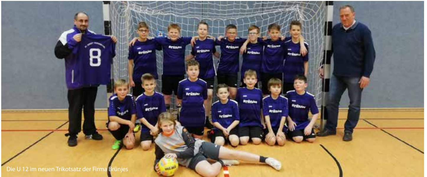
Die U 12 im neuen Trikotsatz der Firma Brünjes

Das lange Suchen nach einem Sponsor hat dank der Zimmerei Brünjes jetzt ein Ende. Nachdem wir über Monate einen Sponsor für neue Trikots gesucht hatten, fanden wir die Zimmerei Brünjes, die sich sofort bereit erklärte, der U12