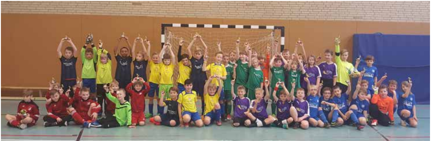
Alle teilnehmenden Mannschaften

Am 11.2. stand für uns der Hallen-Cup des SV Lilienthal-Falkenberg auf dem Programm. Für uns sollte das Turnier als Vorbereitung für das am darauffolgenden Wochenende stattfindende Pokalfinale dienen.