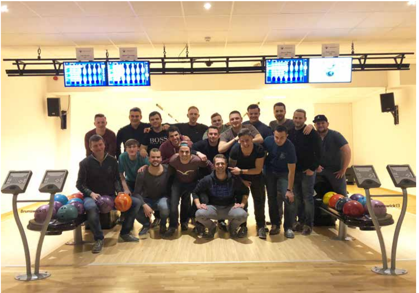
Die 3. Herren beim Bowling