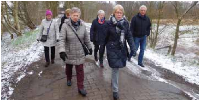
Die Teilnehmerinnen auf dem Weg durch Altenbrück

Am 4. Februar 2018 wollten die Turner und Turnerinnen der Seniorenguppen den Kohl probieren. Um 10.30 Uhr trafen wir uns bei herrlichem Sonnenschein vor dem Vereinsheim, um sich während eines schönen Marsches Appetit zu holen.